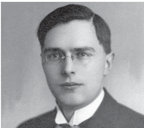
Max Euwe omstreeks 1926