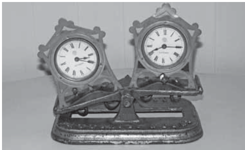
Het ‘wipklokje’ van Fattorini uit 1883.

In 1861 deed de zandloper zijn intrede in de schaakwereld. Voor een match om de (officieuze) wereldtitel achtte men die blijkbaar niet betrouwbaar genoeg, want vijf jaar later speelden Adolf Anderssen en Wilhelm Steinitz met twee klokjes die door een scheidsrechter na elke zet werden aan- en uitgezet. De grote doorbraak vond plaats in 1883 toen op een internationaal