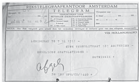
Het felicitatietelegram (in het Duits!) van Botwinnik uit Leningrad