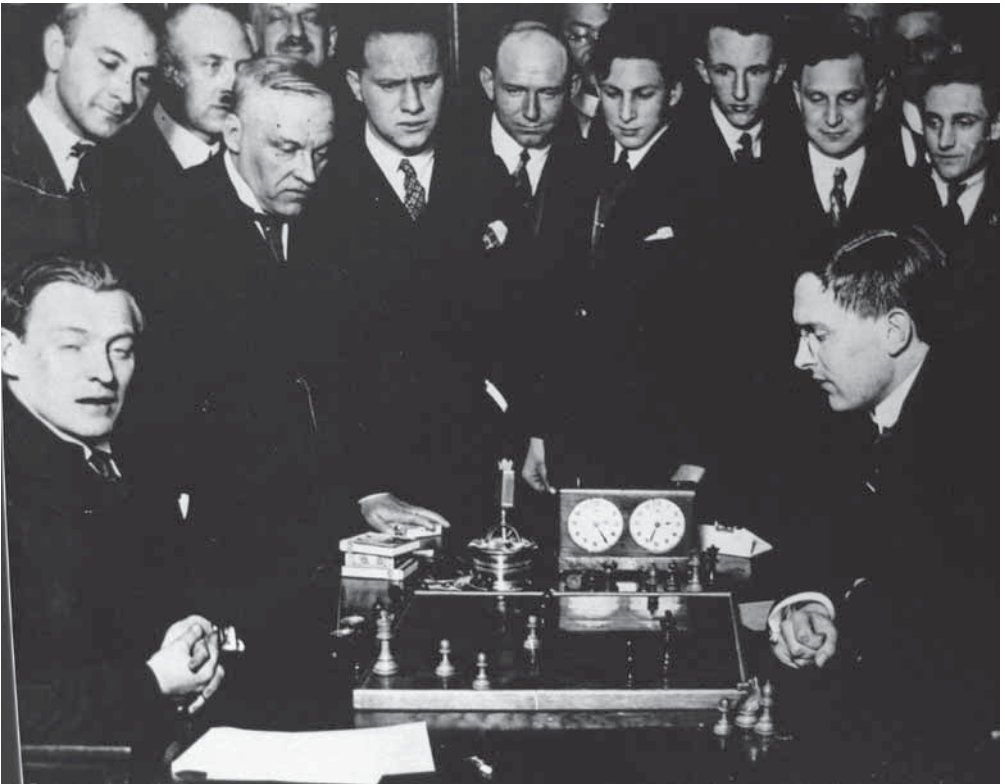
De strijd tussen Aljechin (links) en Euwe in 1926-1927 was onverwacht spannend.

van het matchboek dat VAS na afloop uitgeeft, schrijft hij: “Dat een wedstrijd tusschen Aljechin en Euwe interessant moest worden, blijkt wel uit het voorafgaande; hoe ook de uitslag mocht zijn, men kon mooie, spannende partijen verwachten.” Even verder: “Voor het Hollandsche schaakleven is de wedstrijd van verstrekkende betekenis geweest; hij (Euwe, BS) heeft het doorslaande bewijs geleverd, dat wij eindelijk een meester in ons midden hebben, die hetgeen hij als jong talent beloofde, in alle opzichten heeft gehouden. Een meester die voortaan, waar hij ook komt, zal meetellen.”