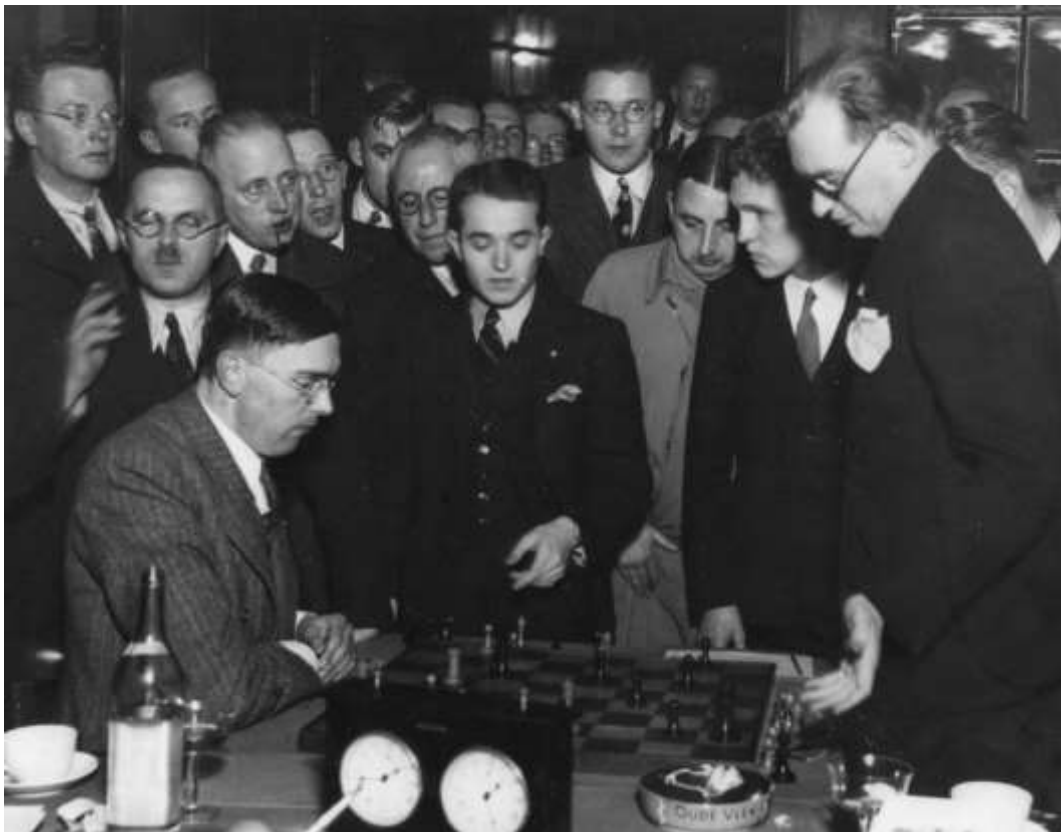
Tussenstand Aljechin-Euwe 12-12

De 24e partij wordt gespeeld in de in 1856 opgerichte herensociëteit 'Eensgezindheid' in het oude centrum van Delft. Aljechin speelt het Hollands, er wordt gesuggereerd dat dit uit beleefdheid tegenover Euwe is, maar het is meer aannemelijk dat tactische overwegingen zijn keuze hebben bepaald. Bovendien is de Hollandse verdediging in die tijd in Rusland erg populair, ook bij bijvoorbeeld Flohr en Botwinnik. Euwe offert een pion en al na 15 zetten 'gooit hij al zijn troepen op den Koningsvleugel'. Doorslaggevend is die niet. Er wordt niet direct opgemerkt dat Aljechin later een winnende voortzetting mist: Euwe maakt een grote fout op de 27e zet die Aljechin even later een gewonnen stelling had kunnen opleveren. Maar hij zag het niet. En de analyses in de dagbladen zeggen niks over deze fouten. Integendeel, in De Telegraaf schrijft Tartakower bij Euwes fout: "Toont een mooien aanleg in het vooruitzien." Bij Aljechin slaat de wanhoop toe. Hij laat zijn horoscoop trekken die hem veel succes voorspelt. Zijn secondant Salo Landau vertrekt voor de tweede keer en wordt op verzoek van Aljechin opgevolgd door de Oostenrijker Ernest Klein. De spanning stijgt, het is nu 12-12 en Euwe moet de match winnen om de titel te veroveren. Bij 15-15 zou Aljechin zijn wereldtitel prolongeren. Aan een beslissing door middel van rapid, snelschaken of armageddon werd nog in de verste verte niet gedacht.