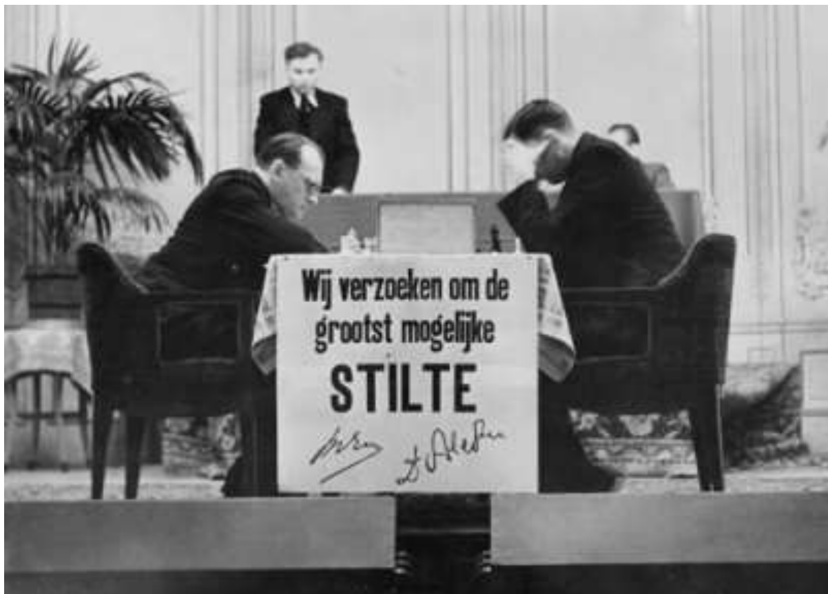
De matadores in volle concentratie