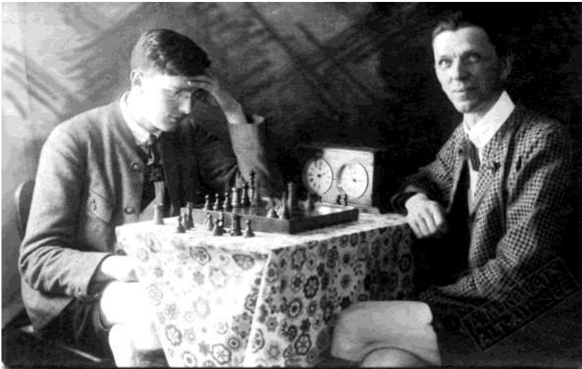
Een jonge Max Euwe spelend tegen Géza Maróczy

Euwe heeft Géza Maróczy als secondant. Hij studeert net als Euwe wiskunde en beschouwt schaken meer als afleiding. Rond de eeuwwisseling is hij een van de sterkste spelers van de wereld. Hij behaalt uitstekende toernooiresultaten in het begin van de 20 e eeuw en een match tegen Lasker om het wereldkampioenschap is bijna rond maar gaat uiteindelijk toch niet door. Na de communistische machtsgreep in Hongarije in 1919 verlaat Maróczy zijn land en hij verblijft dan tijdelijk in Oostenrijk en Nederland, en gaat later naar de Verenigde Staten en Engeland. Max Euwe was in Nederland een van de studenten van Maróczy. In 1921 speelden ze een tweekamp in etappes in Oostenrijk die in 6-6 eindigde. Maróczy was toen al 50 jaar oud, dertig jaar ouder dan Euwe.