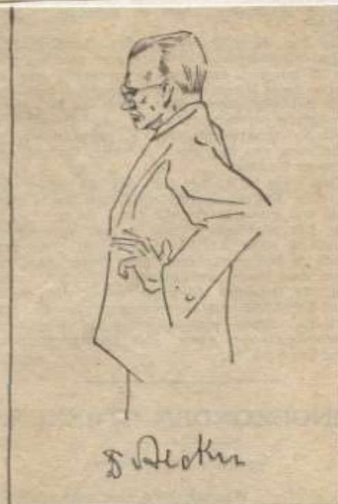
DR. A. ALJECHIN.

Daardoor geeft Aljechin een scherp karakter