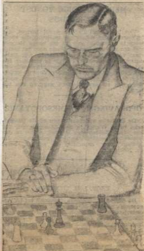
DR. MAX EUWE, ONZE MATADORI

Op alles heeft Wit een behoorlijk antwoord.