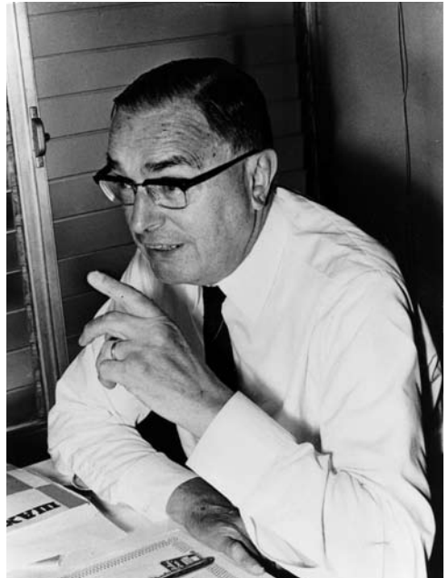
de professor-doctor doceert

Ik heb het proefschrift wel eens bestudeerd in verband met de Christoffel symbolen. Het is degelijk, goed en van hoge kwaliteit en dat in drie jaar. Graag geef ik in dit Euwejaar Euwe een compliment voor deze prestatie. Euwe wilde