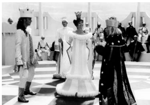
fragment uit Lang Leve de koningin

besloot te stoppen met mijn wiskundestudie en ging naar de filmacademie. Mijn eerste speelfilm Lang Leve de Koningin ging over schaken en die heb ik aan hem opgedragen.