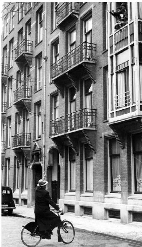
papa Max komt thuis

De vakanties werden door mijn ouders samen geregeld. Bijvoorbeeld de vakantie in Morgin, Zwitserland. Mijn vaders' zuster was weduwe geworden en moest worden opgevangen. Voor haar huurde mijn vader 2 maanden in de zomervakantie een groot chalet waar iedereen van de familie kon komen logeren, zodat ze in die dagen niet alleen zou zijn. Typisch mijn