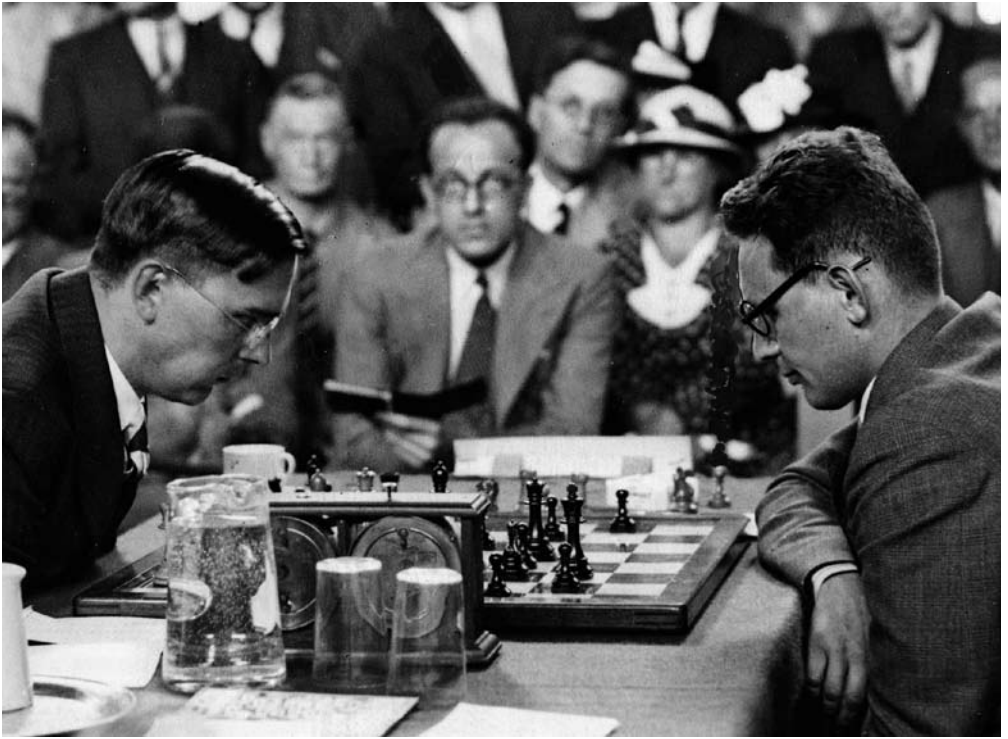
Euwe-Botwinnik, Nottingham 1936

bij de Dode Zee. Iemand had hem verteld dat het zoute water genezend zou zijn voor zijn psoriasis. Daar had hij wel 120 jaar mee kunnen worden, maar helaas vond z'n hart het teveel die berg iedere dag op te lopen. Hij belandde in een ziekenhuis na een hartaanval. Ik ben naar Israël gegaan en heb hem twee weken iedere dag bezocht. Nu vraagt u zich misschien af wat voor diepzinnige gesprekken wij voerden. Dat waren wiskundige vraagstukken, die we samen uitgebreid bespraken. Ook weer typisch mijn vader, ook op zulke momenten de hersenen laten werken, als hij maar niet over zijn gevoelens hoefde te praten. Nadat hij weer terug in Nederland was, heeft hij vanuit z'n bed z'n secretaresse alle post laten beantwoorden. En hij was vast van plan door te gaan met correspondentieschaak.