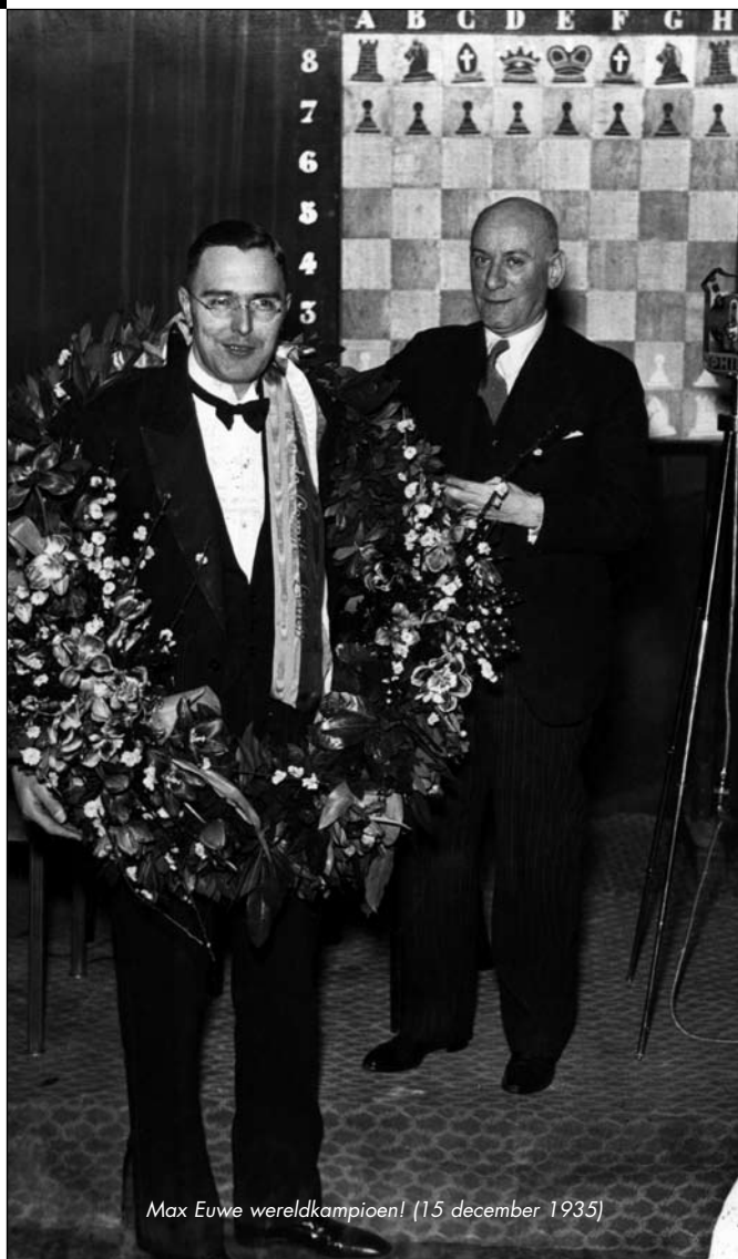
Max Euwe wereldkampioen! (15 december 1935)