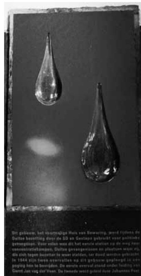
De plaquette in de overkapte doorgang