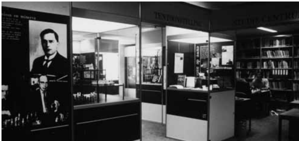
Het museum op de Paleisstraat 1

dan 34.037 leden (een record) krijgen allemaal een acceptgiro om het MEC te ondersteunen. Een maand later: “vele duizenden guldens werden reeds overgemaakt en nog steeds komen er bedragen binnen”. Binnen enkele jaren was er het nodige kapitaal en toen de KNSB verhuisde naar “De Grootte club” op Paleisstraat 1, kreeg het MEC daar ook een vleugel. Op 8 november 1986 was de feestelijke opening in Krasnapolsky, waarna de genodigden de Dam overstaken naar het MEC, een gebeurtenis die ’s avonds zelfs in het journaal aan bod kwam. De tentoonstelling over het leven en de carrière van Euwe was ingericht door Jan-Willem ter Avest en Jeroen Dijkstra, afgestudeerde museologen van de Reinwardtacademie uit Leiden. Naast de tentoonstelling was er een bescheiden bibliotheek, enkele kartotheek, een paar schaakcomputers en uiteraard de nodige tafels met schaakborden om te studeren of te spelen. Het centrum was dagelijks geopend van 10.30-16.00 uur, en in het weekend gesloten. Vanaf het begin was secretaris Leo Diepstraten vrijwel elke dag aanwezig. Jeroen Dijkstra kwam op 1 maart 1987 parttime in dienst om activiteiten en