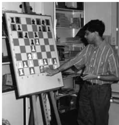
Toekomstig wereldkampioen Anand geeft in mei 1992 training