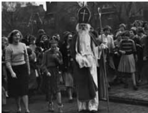
Een sterk schakende Sinterklaas

Ook de afgelopen tijd hebben we weer enkele bijzondere schenkingen gehad. Want zien we op de onderstaande foto niet Sinterklaas?