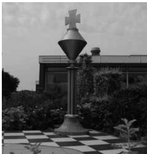
Het beeld in Wijk aan Zee

Onbeduidend als men er niets te zoeken heeft. Een dapper initiatief nam een plaatselijk bouwbedrijf Visser en Hopman op zich; bevorderen van het schaken. Het bouwen van een toren