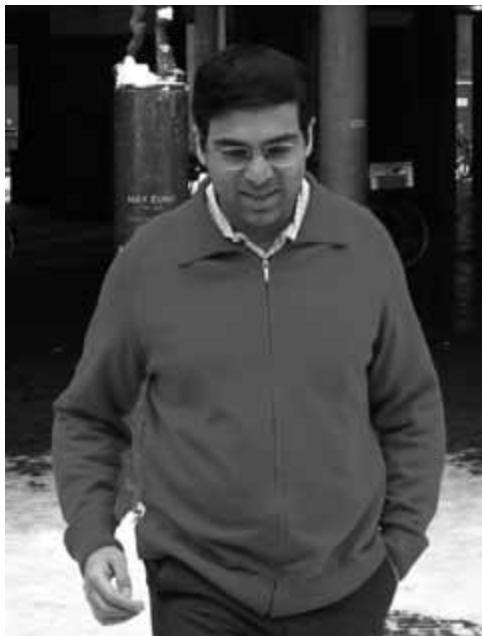
Anand heeft Amsterdam gehaald!