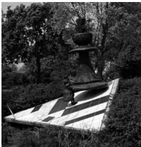
Het schaakbeeld in Bunschoten / Spakenburg

Op de kaart van Nederland is Bunschoten/Spakenburg maar een klein vlekje.