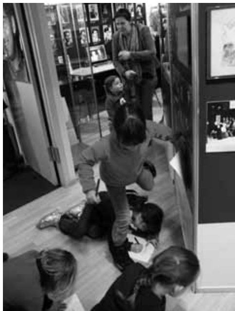
De museumquiz: steeds weer een succes!

Een club, school of groep kan ook buiten onze openingstijden het MEC bezoeken. Neem gerust contact op om een afspraak te maken.