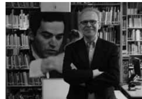
Paul van der Sterren

Paul van der Sterren: Zwart op Wit, vertaald uit het-Pe5xf7!? New in Chess, 2011, 496 pagina's, € 29,90