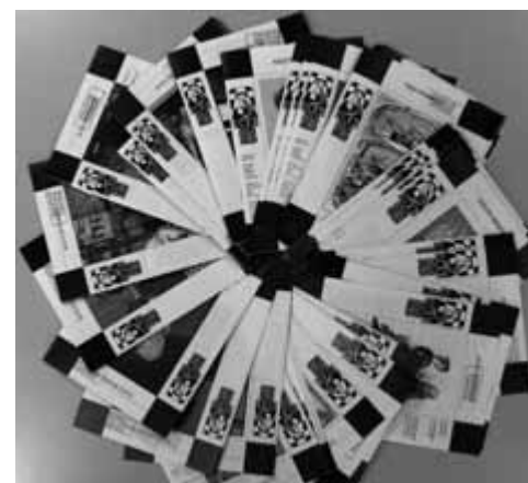
Inmiddels zijn er 78 Nieuwsbrieven verschenen

Al snel bleek de ruimte aan de Paleisstraat te klein voor het MEC. Niet alleen voor de vele boeken, maar ook voor het gestaag stijgende aantal bezoekers. Binnen een jaar na opening werd er al gezocht naar een grotere locatie, het liefst samen met de KNSB. De financiën waren echter onvoldoende om die volgende stap te maken. Via de Nieuwsbrief uitkwam, werden de lezers opgeroepen om donateur te worden, wat 1200 donateurs opleverde. In Schakend Nederland van november 1988 werd de noodklok geluid voor het MEC: “Met de huidige financiële ruimte zal het centrum over een tijdje moeten sluiten. Er zijn wel sponsors te vinden, maar dan zal ook de KNSB een vast bijdrage moeten leveren.” Een jaar besloot de bondsraad één gulden per KNSB-lid aan het MEC te geven, de “Euwe-gulden” was een feit.